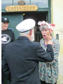
»Hvad sker der lige her, lodsden fyrer rengøringsdamen?«