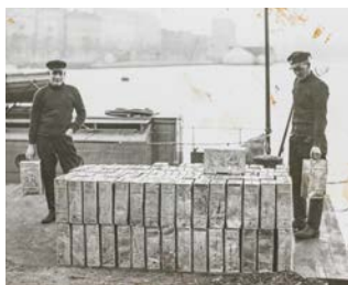
Spritsmuglere i dansk havn i 1930'erne.