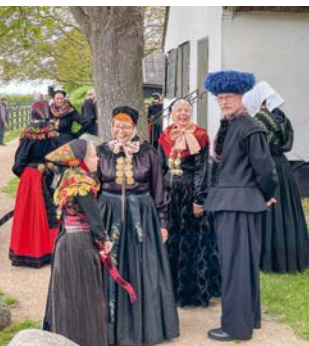
Lokale i amagerdragt ved det royale besøg den 20. maj i år.

Til høstgudstjenesten i år har vi inviteret alle, der deltog i jubilæumsfestlighederne klædt i egen dragt. Det er vores