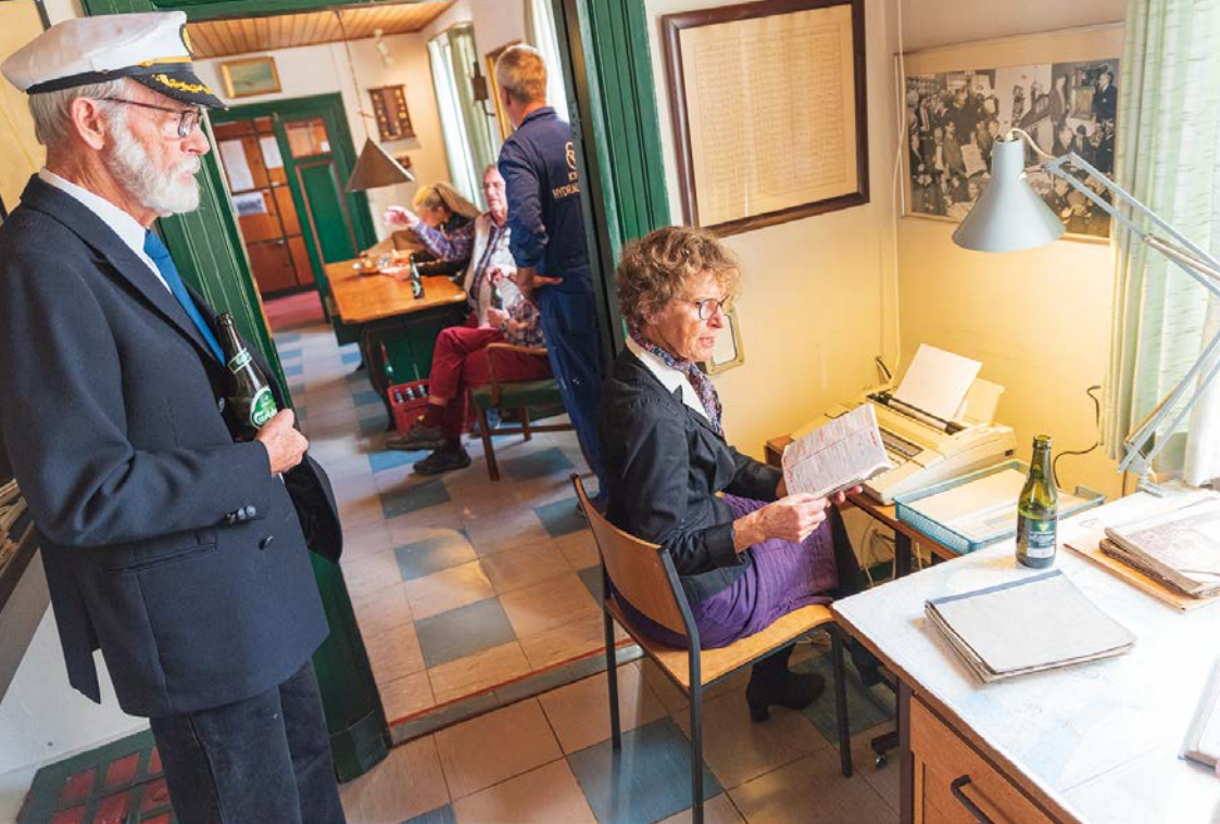
På kulturnatten genopstår den gamle lodsstation fra 1984.