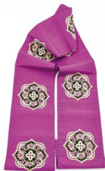
Silkebånd fra en amagerdragt. Fra bogen »Amager – 500 års hollænderhistorie«.