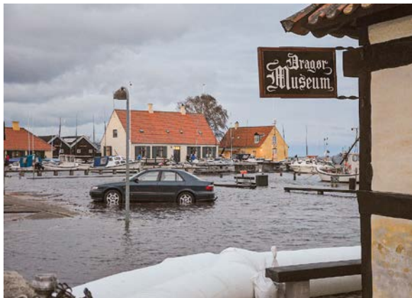
Oversvømmelse på Dragør Havn 2017.