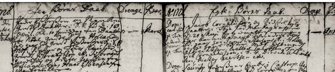
Døbte 1728 i Tårnby Kirke. To udvandrere fra Hollænderbyen med faddere fra hjembyen.

Da Store Magleby Kirke var ejet af og blev vedligeholdt af Hollænderbyens bønder, måtte dragørerne betale for deres pladser i kirken.