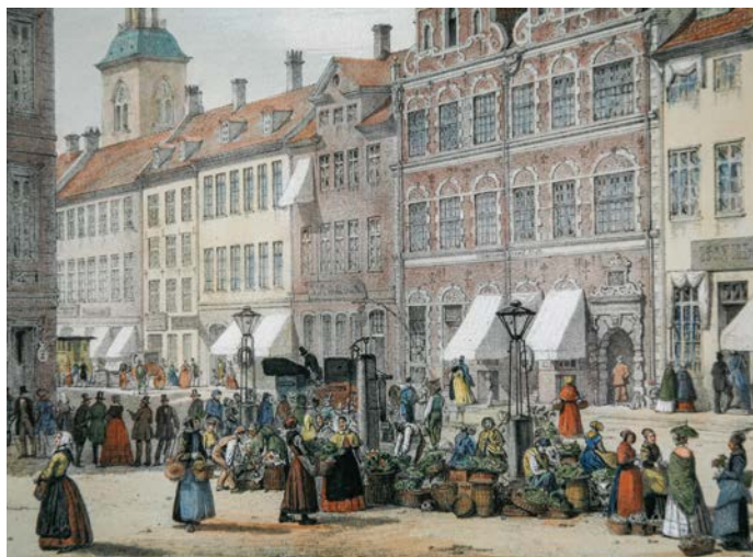
Amagertov i 1800-tallet.

Hvis det skulle fortsætte, forlangte de en vis ret til gårdsbygningerne. Ullerup landsby havde allerede to år tidligere givet afkald på hjælpen, mens de øvrige byer afskrev sig denne bygningshjælp i 1756.