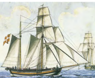
U. A. Knippel: Galeasen Ane Margrethe Kirstine, 1832. Museum Amager.

I Dragørdialekten er der også spor af hollandsk. Vierdiget på strandengene syd for Dragør er et oprindeligt hollandsk stednavn, der betyder tangdige. Betegnelsen væl, et hollandsk ord for vandhul, findes i flere stednavne i Dragør som Nordre