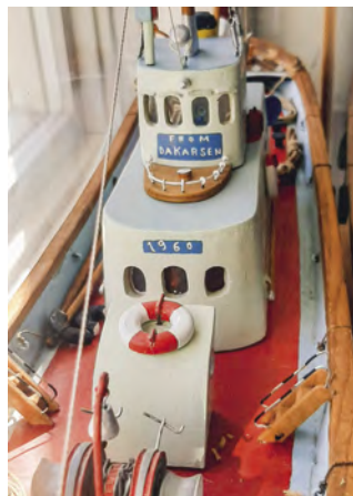
Skibsmodellen Poseidon.