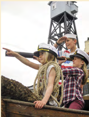
Til venstre: Lodsbåden males.