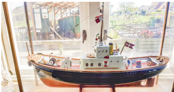
Model af Københavns lodsbad Poseidon.

Vi glæder os til at tage imod rigtig mange sommerglade gæster.