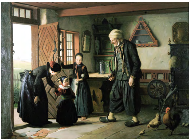
Julius Exner: Besøget hos Bedstefader, 1853. Museum Amager.

Byvandringen udbydes også som tema-byvandring via Dragør Besøgscenter i Havnepakhuset.