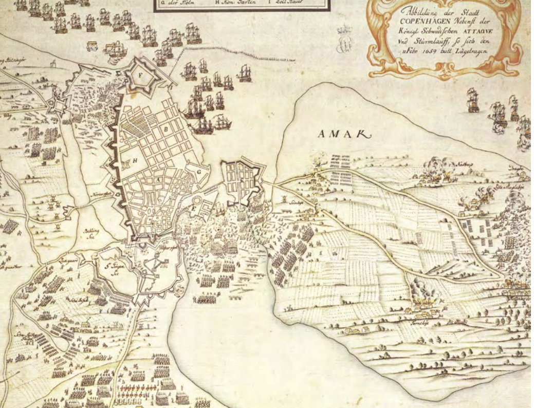
Abbildung der Stadt Copenhagen nebenst der Königl. Schwedischen Attaque. 1659. Det svenske angreb på Amager.

Næste side: Amagerkvinderne var dybt involveret i dyrkning og salg af gårdenes produkter. Julius Friedländer: En russisk sømand køber grøntsager af en amagerkone ved Amagerport.