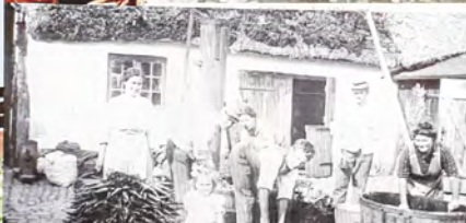
Planche fra et online-kursus ved Bettina Buhl.

bønder om at komme til Amager. Dette fik en væsentlig indflydelse på dyrkning af grøntsager i Danmark og dermed på den danske madkultur.