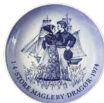
Platte fra kommunesammenlægningen Dragør/Store Magleby 1974. Sømand og skib, amagerpige og kornmark symboliserer forskelle og samarbejde.