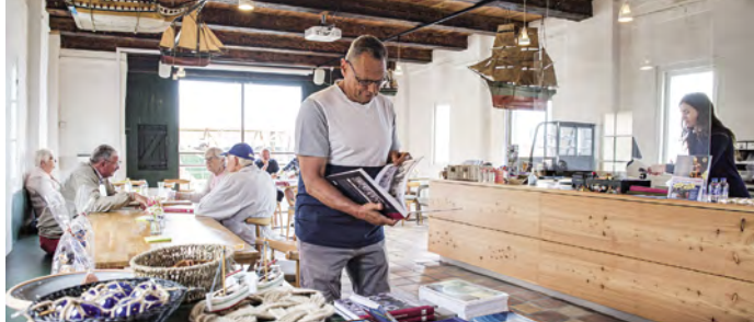
Dragør Besøgscenter i Havnepakhuset.