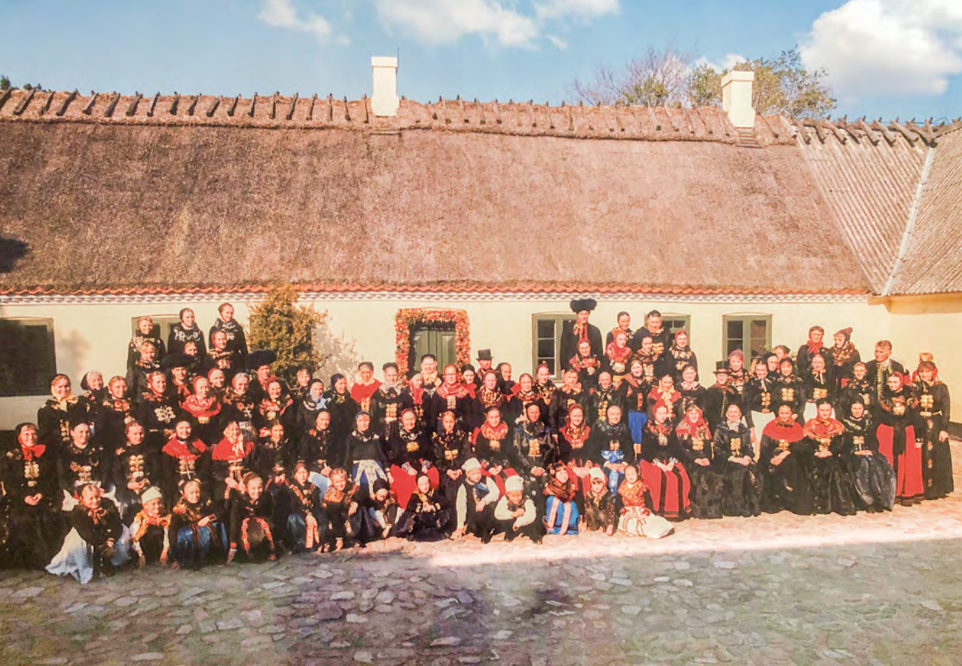
88 amagerklædte piger, drenge, mænd og kvinder.

hvor knap 100 amagerklædte børn, kvinder og mænd samt kirkens præster tog imod.