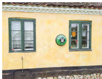
Til højre: Frivillige og ansatte stod for sommeraktiviteterne på Amagermuseet.