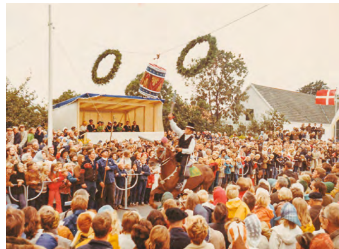
Tøndeslagning i Møllegade.

Gennem de udstillede værker kunne man i tanken gå fra den hollandske virkelighed til Amager på samme tid bl.a. gennem Jacob Grimms værk: Køkkenhave ved bondegård,