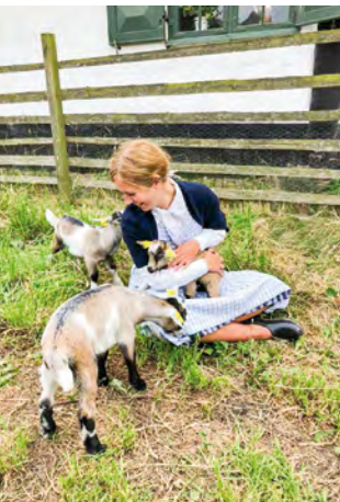
Gedekiddene var populære.

blev der vasket og bagt i sommerkøkken. Tak til alle jer, som beredvilligt har støttet museet.