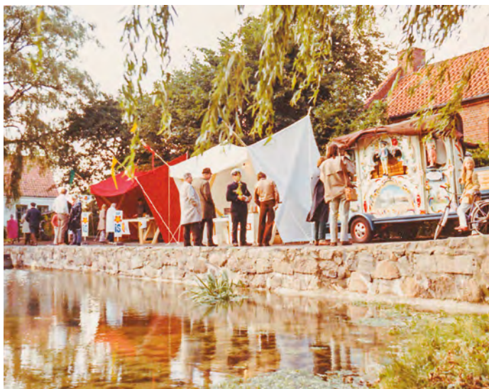
Boderne ved gadekæret med det hollandske orgel.

Så alle sejl blev sat til for at fejre dette jubilæum fra både kommune, museumsforening og lokalkiv!