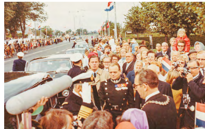
De kongelige modtages ved rådhuset i overværelse af en stor mængde borgere og fotografer.

Dagen efter, fredag den 10. september fandt de større festligheder sted med kongeligt indslag. Kongeparret, Frederik 9. og Dronning Ingrid, Kronprinsesse Margrethe, Prins Henrik, og det hollandske kronprinsepar, Beatrix og Prins Claus ankom i biler og blev eskorteret af 25 fastelavnsryttere fra bygrænsen til rådhuset, hvor de kongelige blev modtaget af borgmesteren og kommunalbestyrelsen. De kvindelige kongelige modtog buketter af piger i amagerdragter.