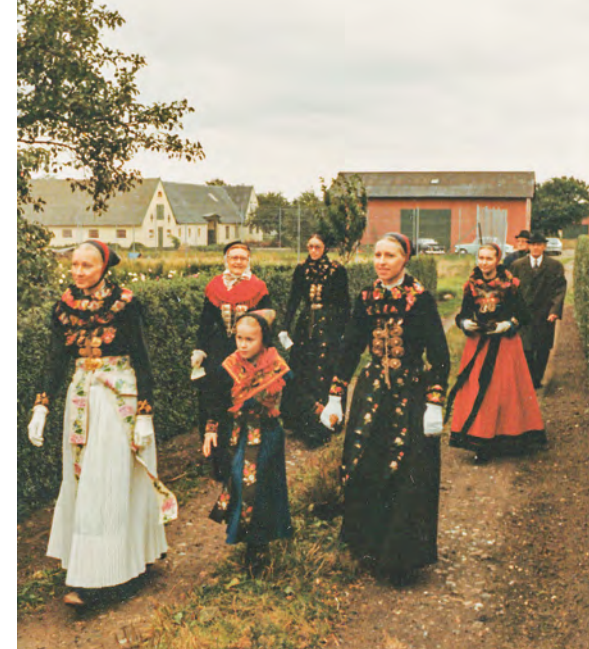
Familien Dirchsen på vej til jubilæums- gudstjeneste 1971.

Hvis du er interesseret i at modtage foreningens nyhedsbreve, så send en e-mail til ammu.venner@gmail.com med teksten: »Nyhedsbrev – ja tak!«