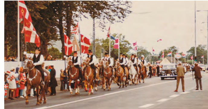
Fastelavnsryttere eskorterer de kongelige biler til rådhuset.

En af datidens indvandrere, en libanesisk gæstearbejder og kunstner, forærede et af sine malerier til kommunen.