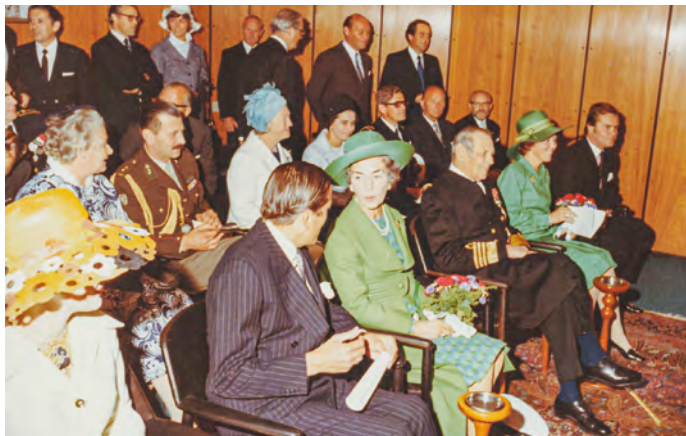
De kongelige i rådhusalen.