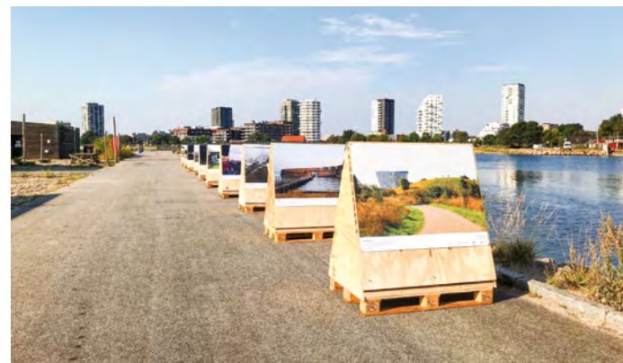
Udstillingen som den var opstillet på Amager Strand.

Fotografen, Rikke Colburn, har igennem de sidste par år taget billederne, som et led i podcastserien Stemmer Fra Amar , som ligeledes fortæller øens historie.