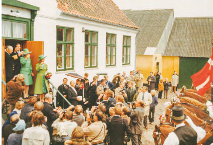
Tøndekongen hyldes.

der var malet i sidste halvdel af det 16. århundrede. Eller Hendrick Maartenszn Sorgh: Grønttorvet, dateret 1667.