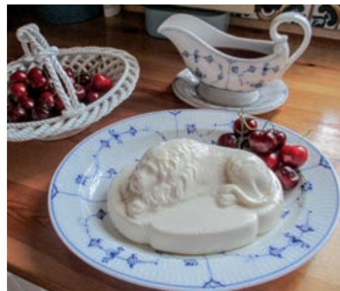
Marchen Mikkelsdatters forlorne rombudding. Smagen af Dragør og Store Magleby.