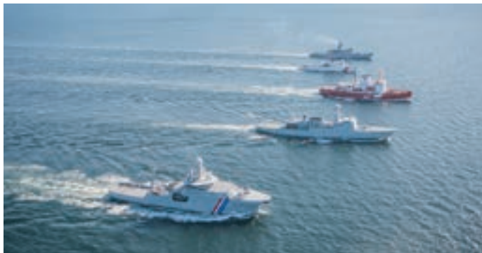
Søredning i Arktis.