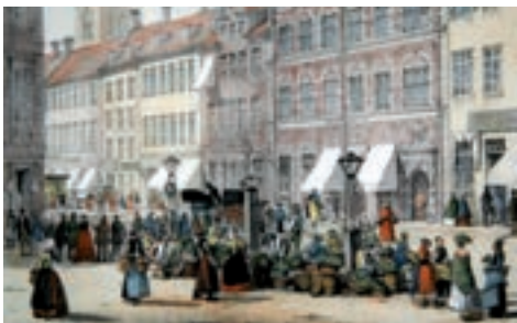
Amagertorv i 1800-tallet. Privateje.

Denne aften skal vi også høre den personlige erindring om torvekørsel og torvehandel i vor tid, og vi skal høre de gode historier, som er blevet fortalt i familierne og blandt venner og bekendte.