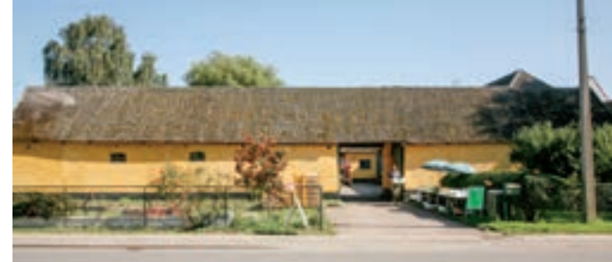
Møllegade 7.

Ud fra en brandtaksation fra 1837 får man et indtryk af indretningen. Gården var firlænget og længerne sammenbygget