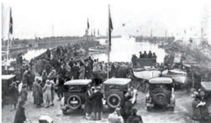
Tilskuere er valfartet til Dragør for at overvære tøndeslagningen i havnen i 1928.

Tønden hang i et tov udspændt tværs over havnen mellem