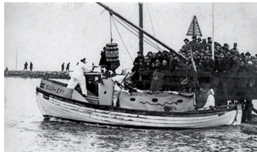
Så slæses der til tønden i Dragør Havn. Ca. 1927–1931.

Hvornår, løjerne til søs ophørte, er usikkert, men sandsynligvis i 1930'erne. Til gengæld forsatte tøndeslagningen til hest.