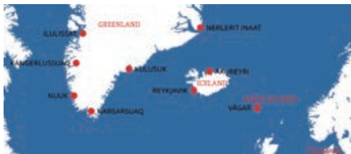
Del af kort over Grønland.

Årets ARCTIC GUARDIAN havde til hovedformål at træne de otte deltagende nationer i samarbejde og kommunikation.