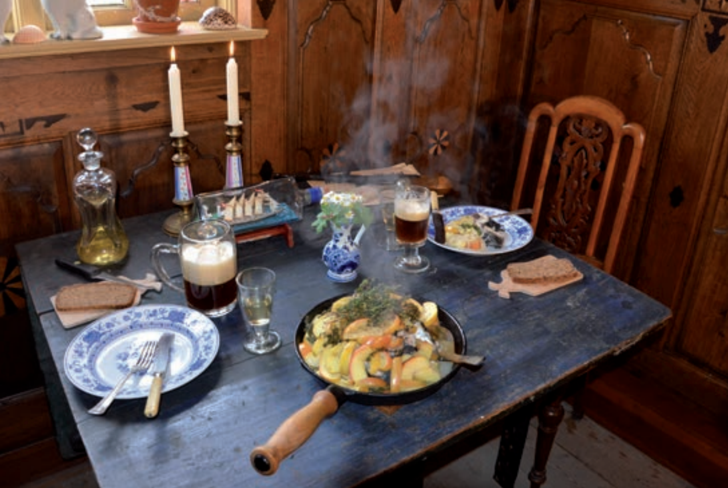
Pandesild og pandeål. Foto: Amagermad. Smagen af Dragør og Store Magleby.