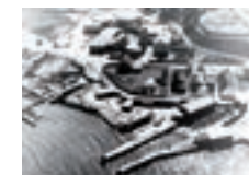
Hobro Værft.

Som bindende tilmelding indbetales beløbet til Lodsmuseumsforeningens konto.: 6508 3053021300 senest fredag den 2. marts 2018.