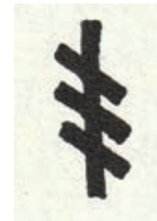
Bomærke. Foto: Hermann Riber – »Hollænderbyens bomærker«.