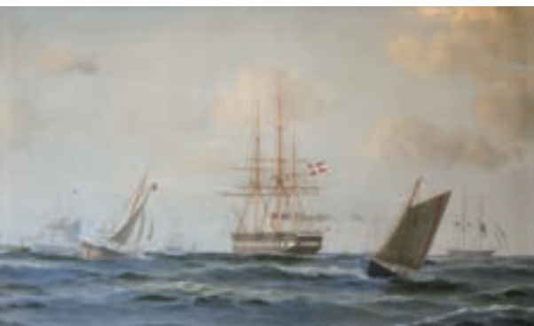
Henrik Strømberg: Fregatten Jylland. Museum Amager.

Amagerhylden hang tidligere i næsten hvert et hjem, men gik af mode. Nu ses amagerhylden igen i boligindretningen.